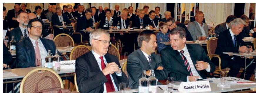
L'assemblée plénière de constructionsuisse a été entièrement consacrée à l'appréciation de la situation sur le plan politique et économique.

Selon l'ancien Conseiller fédéral Kaspar Villiger, il faut engager des réformes afin que la Suisse fasse à nouveau partie du peloton de tête. Dans son exposé, le président du conseil d'administration de l'UBS a illustré les mesures à prendre à long terme afin de garantir le maintien des avantages comparatifs, tels qu'assurances sociales saines, infrastructures performantes et conditions-cadres macro-économiques favorables. A son avis, les taux d'intérêt trop bas pendant une longue période ont entraîné des distorsions et des risques. Notre pays doit demeurer attrayant pour les investisseurs, il le sera si l'on engage les mesures qui s'imposent. Pour Kaspar Villiger, il faut que la politique veillant à garantir l'attractivité de notre site soit une tâche permanente. Il attend un avantage structurel pour la recherche sur les innovations. Même si les problèmes de crise dominent, il est indiqué de ne pas perdre de vue les facteurs de succès de la Suisse à long terme.